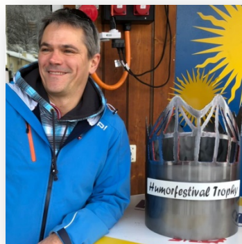
Pokal Künstler Jörg Hösli